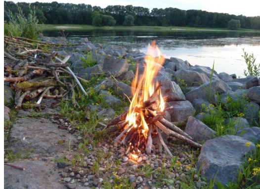
An der Elbe

Die Seminarteilnehmer lernen, die Auswirkungen traumatischer Erfahrungen auf Körper und Psyche zu verstehen. Sie üben, Selbstablehnung schrittweise aufzulösen. Sie entwickeln Selbstachtung, Selbstverständnis und Selbstliebe.